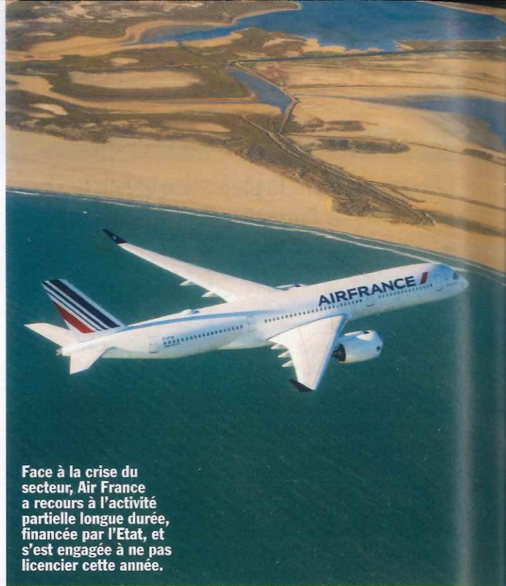
Face à la crise du secteur, Air France a recours à l'activité partielle longue durée, financée par l'Etat, et s'est engagée à ne pas licencier cette année.