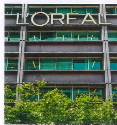
L'an dernier, L'Oréal (16 e ) a lancé un vaste programme pour soutenir les jeunes dans leur recherche d'emploi, notamment ceux issus des banlieues (stages, mentorat...).