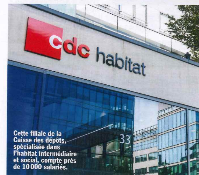
Cette filiale de la Caisse des dépôts, spécialisée dans l'habitat intermédiaire et social, compte près de 10 000 salariés.