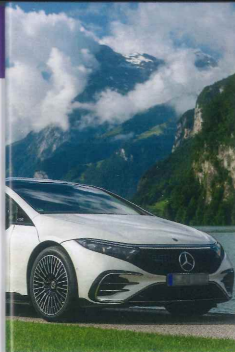
Outre son siège à Montigny-le-Bretonneux (78), Mercedes-Benz (1 er ) dispose de deux sites logistiques, à Valenciennes et à Valence, sans compter les succursales.

lant dans des entreprises de plus de 500 personnes, pour leur demander non seulement ce qu'ils pensent de leur société mais aussi de celles qu'ils connaissent dans leur secteur d'activité. Sur plus de 2 100 groupes étudiés, seuls les 500 ayant reçu les meilleures notes sur 10 ont été retenus, avec un écart allant de 8,53 pour le numéro 1, Mercedes-Benz, à 6,66 pour le dernier. A noter que l'appréciation moyenne (7,22) est en légère progression sur un an : le signe sans doute que les salariés ont fait preuve de mansuétude dans leur jugement, même si le quotidien n'a pas toujours été simple. Le fort rebond de l'activité constaté l'an dernier dans la plupart des secteurs a probablement aussi joué, le fait de conserver son emploi étant un vrai soulagement pour beaucoup. D'ailleurs, bien des entreprises ont dégagé de plantureux résultats grâce aux efforts de leurs équipes. La question d'une revalorisation générale des salaires est ainsi revenue dans l'actualité dans de nombreuses branches. Rendez-vous dans un an pour savoir si tous auront obtenu satisfaction. ■